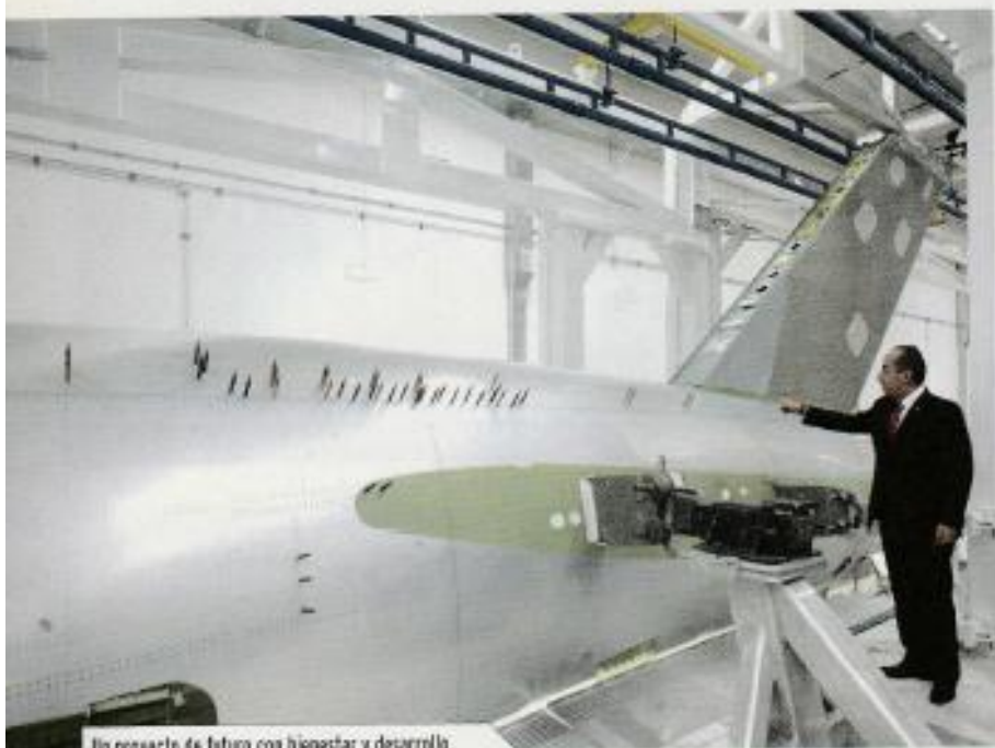
Un proyecto de futuro con bienestar y desarrollo.

un proyecto de largo plazo muy difícilmente vamos a avanzar", puntualiza.