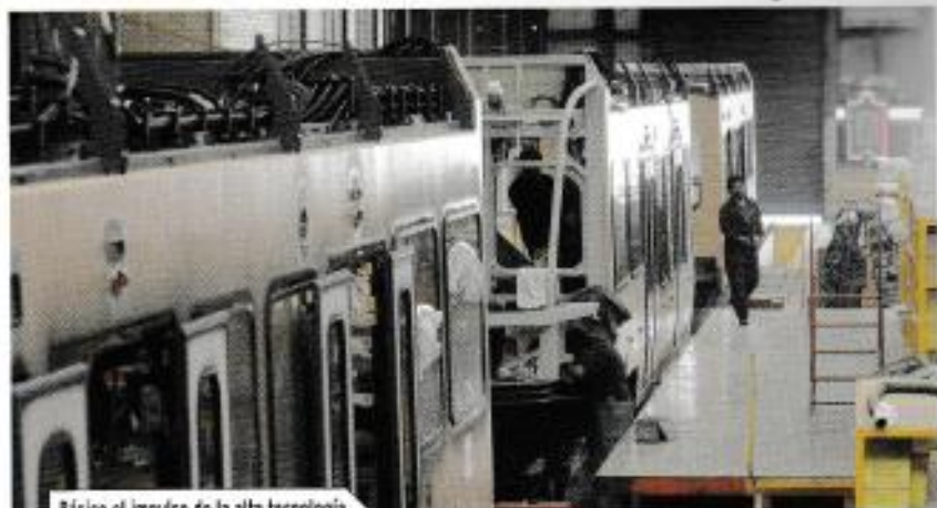
Básico el impulso de la alta tecnología.

Para tener una idea del reto que enfrenta México — resalta —, hay que considerar que para duplicar el PIB tendrían que pasar más de 100 años. “Hoy en día tenemos un ingreso per cápita de ocho mil dólares anuales, contra 40 mil en Estados Unidos, lo que significa que ellos producen cuatro veces una riqueza mayor que México. Si seguimos con esta tendencia, nunca vamos a alcanzarlos”, explica.