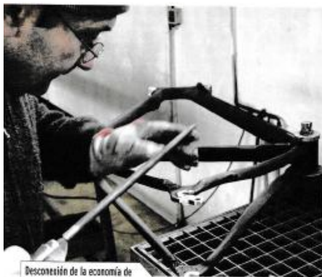
Desconexión de la economía de exportación y del mercado interno.

Explica que la variable más importante para la economía es el Producto Interno Bruto (PIB), que representa la producción que se genera en el país en un tiempo determinado, y en los últimos años se ha observado un crecimiento por abajo del potencial de crecimiento, que debería ser hasta de 4%, pero hemos estado creciendo a .8%, en parte debido a la crisis económica.