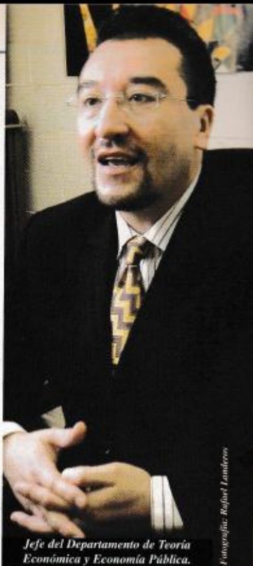
Jefe del Departamento de Teoría Económica y Economía Pública.

M.C.J.- Así es. Y, además, la caída de las remesas podría venir aunada a un desplome de los precios del petróleo, que no se podrán sostener, durante muchos años, en los niveles, históricamente altos, en que se encuentran ahora. Básicamente, el gobierno no toca las remesas, pero éstas permiten que alrededor de 1.5 millones de familias tengan recursos para alimentarse, y provocan otra cosa que los economistas denominamos el efecto multiplicador: cuando llegan estos dólares, quienes los reciben gastan en zapatos, comida, ropa, etcétera, y esto genera una derrama económica en beneficio de sus comunidades. Cuando esto deje de