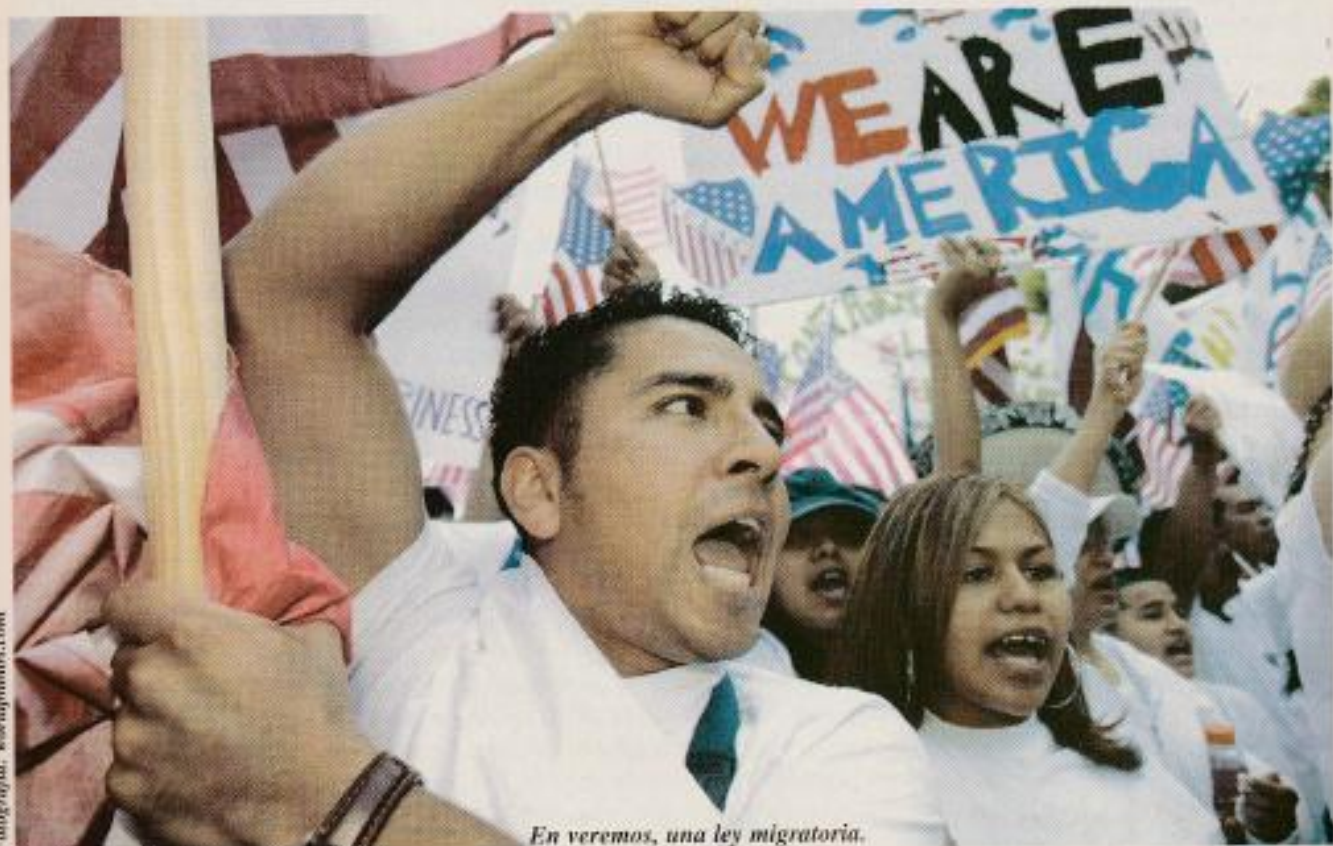
En veremos, una ley migratoria.